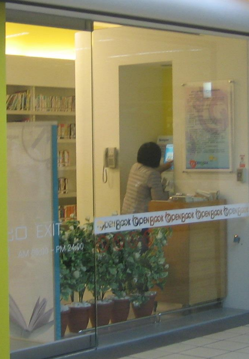
台湾地下鉄駅の無人図書館