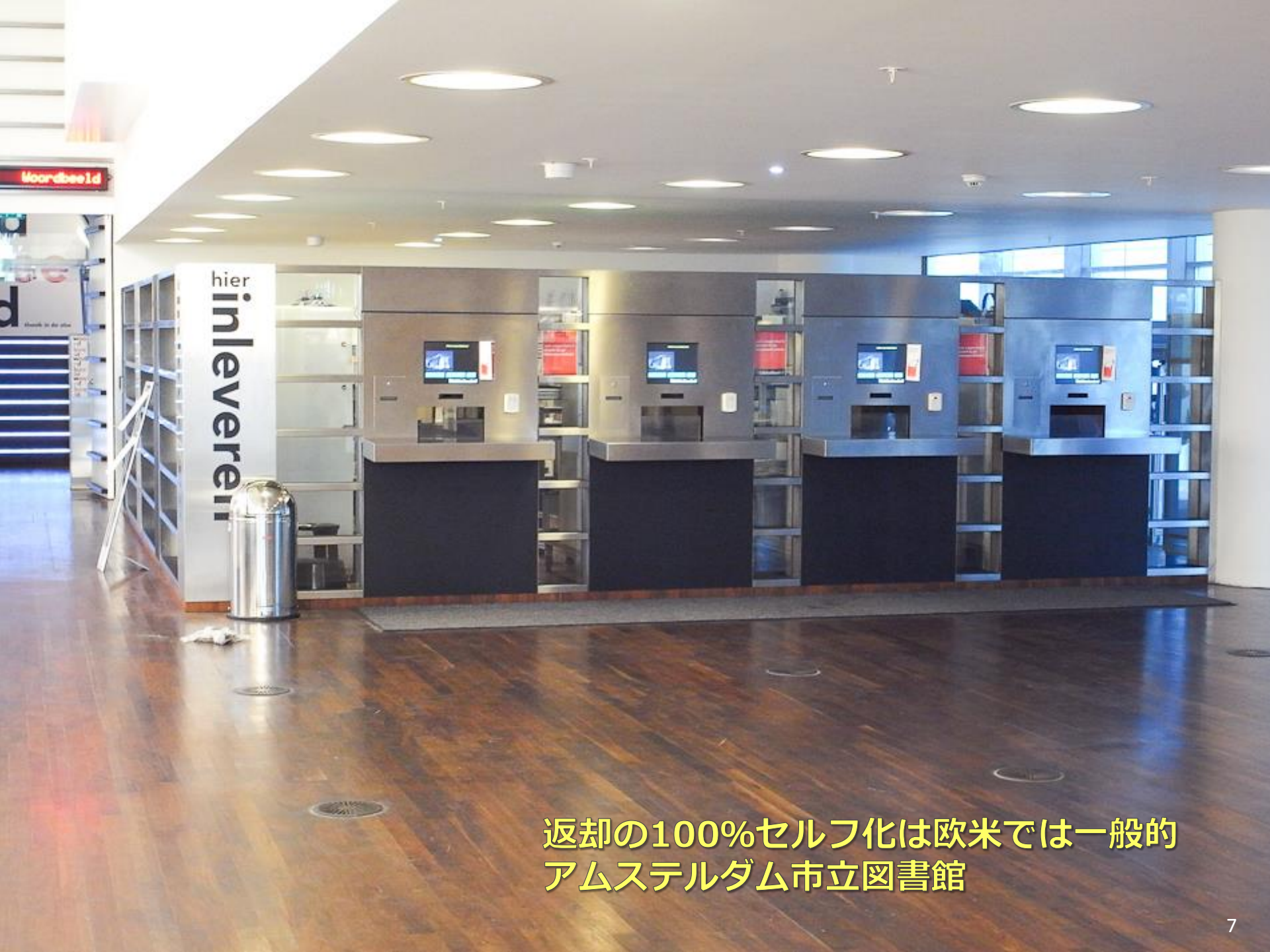
返却の100%セルフ化は欧米では一般的 アムステルダム市立図書館