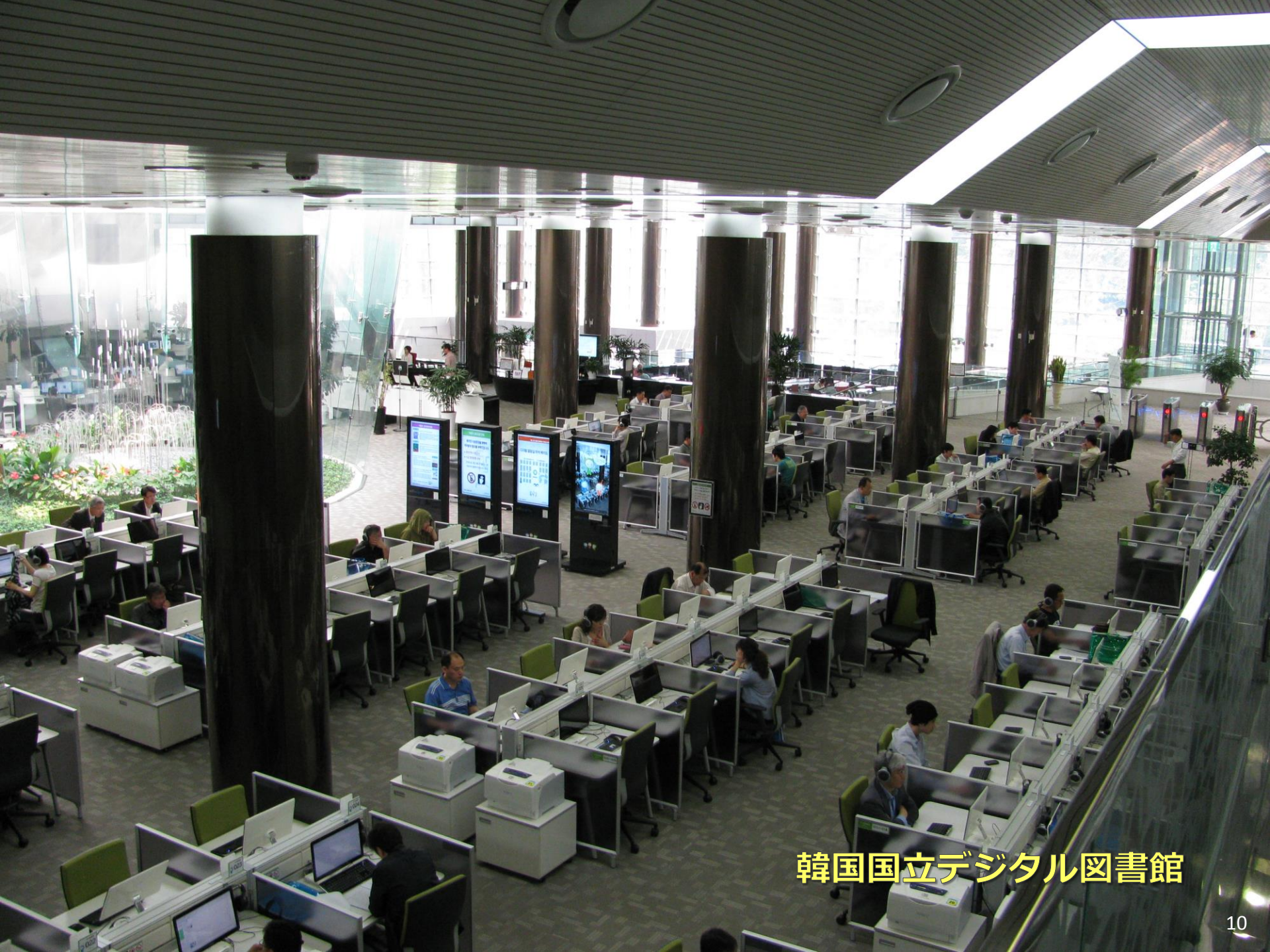
韓国国立デジタル図書館